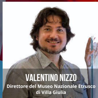
VALENTINO NIZZO Direttore del Museo Nazionale Etrusco di Villa Giulia