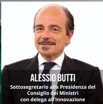
ALESSIO BUTTI Sottosegretario alla Presidenza del Consiglio dei Ministri con delega all'Innovazione