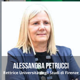
ALESSANDRA PETRUCCI Rettrice Università degli Studi di Firenze