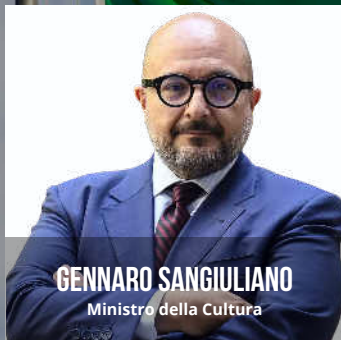
GENNARO SANGIULIANO Ministro della Cultura