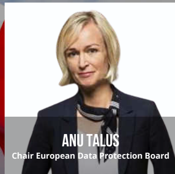
ANU TALUS Chair European Data Protection Board